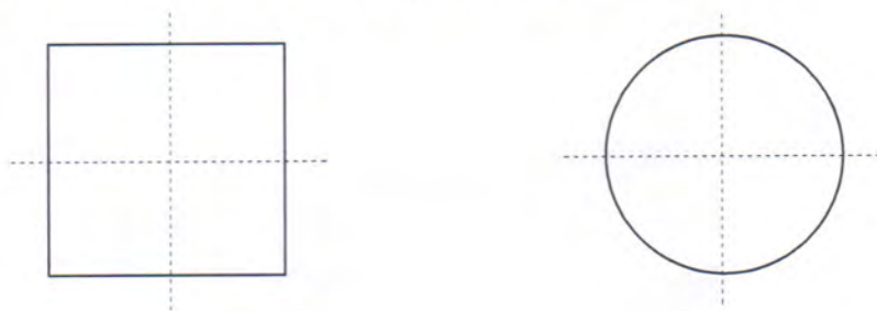
图 1 偏载检定区域划分示意图

在承载器上加载相当于 1/3 Max 的砝码，使用质量值大的砝码优于使用质量值小的砝码组合。若使用单个的砝码，应将砝码放置在图 1 所示的承载器 1/4 的区域的位置；按照公式（1）计算示值误差，其示值误差应符合 5.5 的要求。